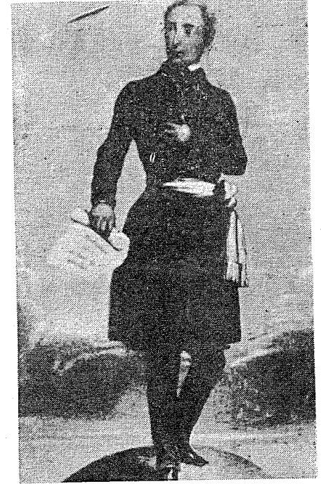
Lamartine, Bergues Milletvekili.

Lamartine monarşik zümreye mensup bir aileden gelmektedir. Babası, şövalye de Lamartine, hicret etmeyi reddetmiş olmakla beraber, XVI. Louis'yi İsviçreli-lerin yanı sıra savunmaktan da geri kalmamıştır. Ve kralın hizmetinde olmayı dinî bir emir sayan bu asker, Tuileries