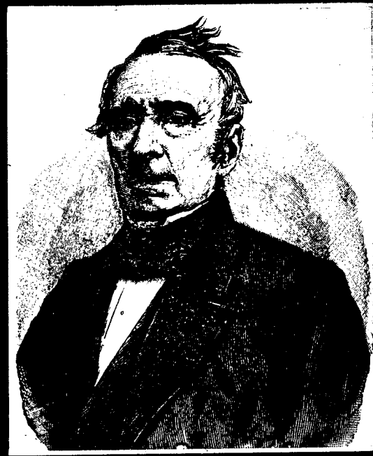
Alphonse de Lamartine.

«Allah, orada (Türkiye'de) buradakin- den (Fransa'dakinden) daha fazla görü- nüyor. Bunun için, Orada ihtiyarlamak ve ölmek istiyorum.» — Lamartine —