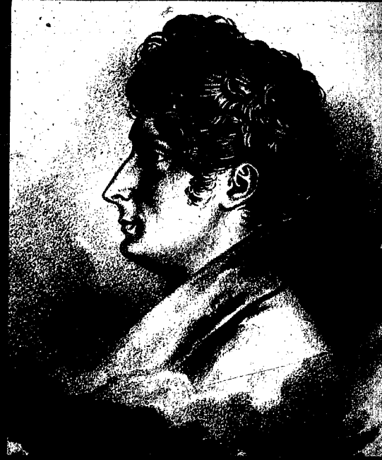
Alphonse de Lamartine.